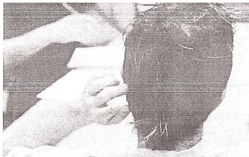
St phane s'en est sorti apr s 20 ans de consommation d'alcool et de drogue